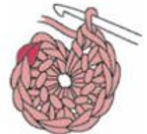
Den Boden häkeln 2