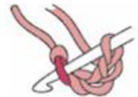
Den Boden häkeln 1