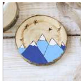
exemple montagnes enneigées