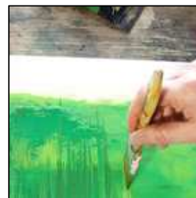
Fig. 1 : les pinceaux - la forme de chaque pinceau détermine un usage et un résultat. Pour débiter il est judicieux de choisir un assortiment et de faire quelques essais pour juger le rendu et choisir le modèle approprié pour votre projet.

Fig. 2 et 3 : les motifs géométriques - faciles à réaliser car vous pouvez délimiter les surfaces avec de l'adhésif de masquage si vous souhaitez des bords nets, ou créer des surfaces plus approximatives, encadrées par une bordure tracée à main levée pour structurer l'ensemble. Adoptez le style contemporain; en variant les textures, en travaillant la matière et en associant des couleurs harmonieuses, vous serez surpris du résultat !