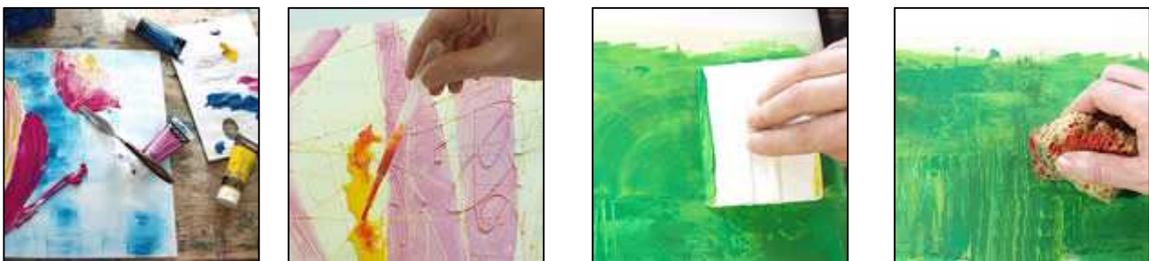
Fig. 9 : les couleurs sont la base; vous pouvez les épaissir, les diluer, les mélanger, ajouter des paillettes, des mediums pour des effets brillants ou nacrés... cet univers est sans limites. Le marché propose également des peintures magnétiques, des produits pour obtenir des effets de rouille, des effets vert-de-gris, des matières minérales telles que lave, sable ou béton qui peuvent apporter de l'originalité à vos projets.